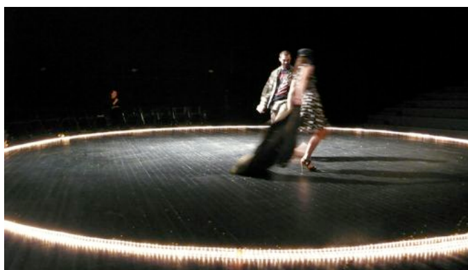
Scénographie pour WOYZECK au Théâtre de La Vignette à Montpellier : Public sur le plateau, gradins désossés, sièges rouges et velours enlevés, cercle de lumières, Les acteurs jouent à proximité du public et dans les gradins.