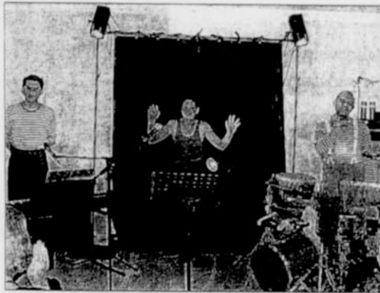
La troupe aixoise du Maquis a interprété avec beaucoup d'humour et d'entrain "Les deux morts de Quinquin la Flotte".